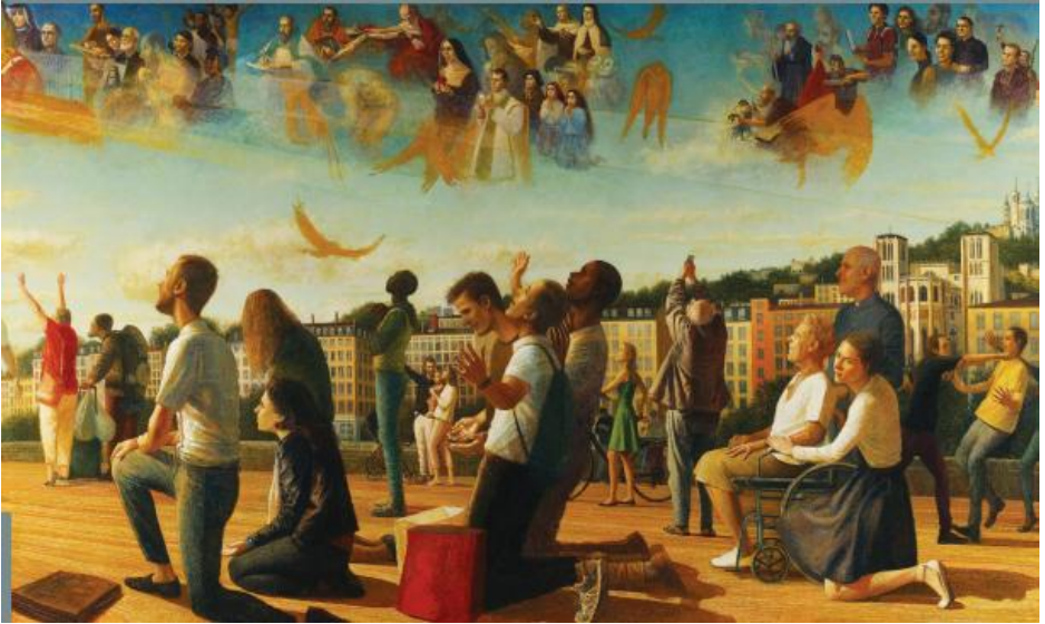
Les trois panneaux ouverts