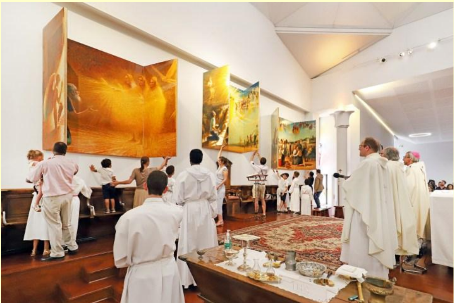
Ouverture du retable de 11 mètres de long par des familles de la paroisse de la Trinité, à Lyon

Conformément à son style unique, que le public a pu déjà découvrir avec le chemin de croix qu’il a réalisé en 2019 pour l’église Saint-Nizier de Lyon, Bruno Desroche aime peindre ses contemporains, avec leur look d’aujourd’hui, jean et basket, portable ou vélo à la main, afin “d’inviter le spectateur à entrer dans l’image”. Et ce sont souvent les paroissiens qui servent de modèles. Ici le sacristain en Abraham, là une responsable des équipes saint Vincent de Paul à côté d’un sdf du quartier, ou encore un jeune couple de la paroisse, avec dans la poussette leur premier-né. “Pour que tous se sentent appelés et comprennent que Christ est vivant et présent aujourd’hui, au milieu de nous”, explique le peintre.