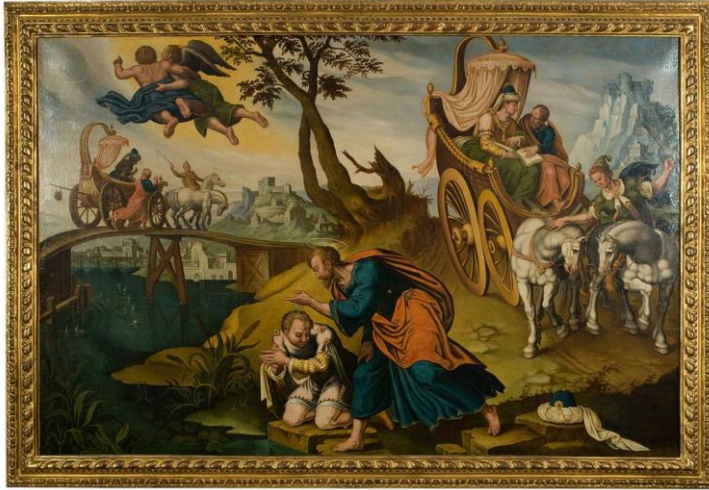
Marteen Van Heemskerck, Le baptême de l'Ethiopien , huile sur toile, XVI ème siècle, 202x132