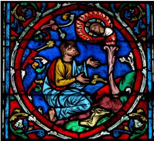
Vitrail de l'Arbre de Jessé à Notre-Dame-de-Paris. Domaine public

déjà l'Arbre de Jessé réalisé en 1864 par Édouard Didron sous la direction d'Eugène Viollet-le-Duc.